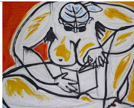
„Lolita“, Öl/Leinwand, 80x100, 2014 (aus der Serie „Halensee Lektüre.“)